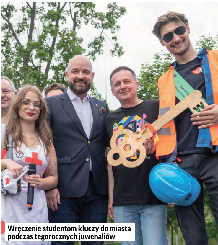
Wręczenie studentom kluczy do miasta podczas tegorocznych juwenaliów